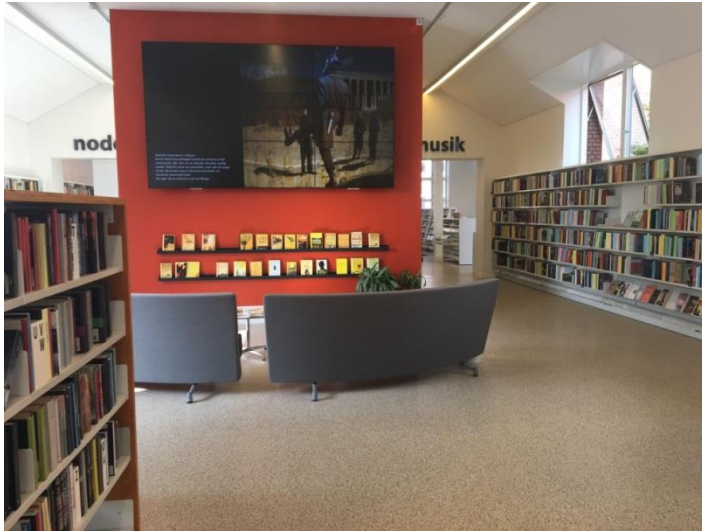
Oplevelse, Silkeborg Bibliotek, august 2018

Lav en kort videopræsentation med jeres idéer (forestil jer enten, at I skal lave oplægget til jeres kollegaer, eller at det er en færdig video til facebook, instagram og youtube til bibliotekets lånere). Når I er færdige, så gå tilbage til makerspace og præsenter jeres (video)fremlæggelse for klassen.