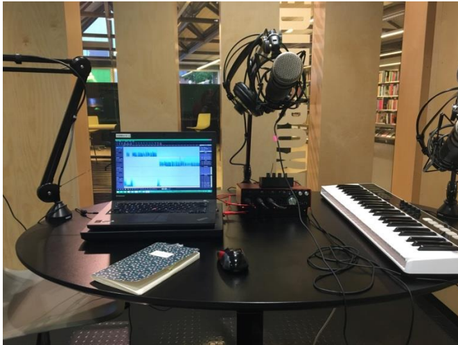
Medieboxen på Silkeborg Bibliotek – men podcast-stationen kan laves med ganske simpelt udstyr.

Sammenlign digtet med jeres udleverede sekundærlitteratur. Gem filen på jeres lærers USB, og lad den blive i til næste gruppe. Hvis filen er optaget via smartphones kan den fx uploades til en mappe i Google Drev via en Google Drev-app.